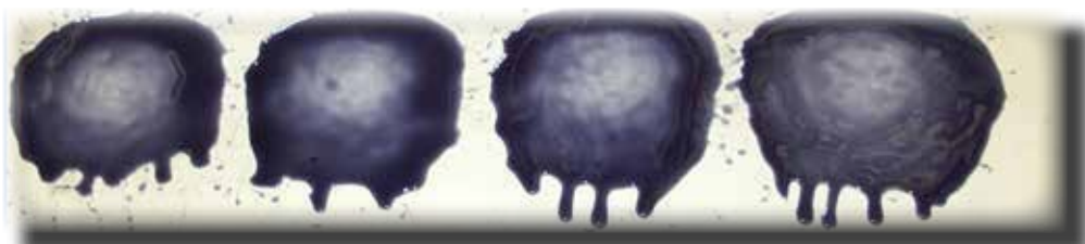
改用 Pyroshield 合成油 - 開放式齒輪潤滑油噴劑之後的情形。噴嘴不會因 Pyroshield 液態潤滑油而堵塞，可在齒輪上形成更具保護力、噴灑均勻的潤滑油油膜。