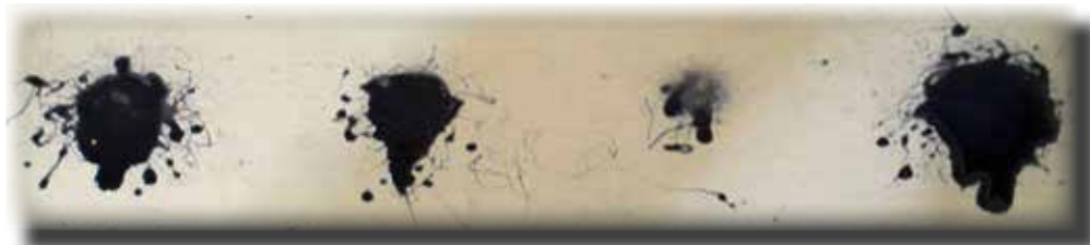
使用常規等級潤滑油噴劑的情形。傳統型瀝青潤滑油導致噴嘴堵塞，導致潤滑劑用量不夠，進而造成齒輪上產生破壞性熱燙點。